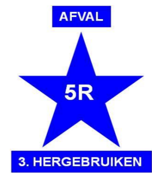
5R - 3.REUSE