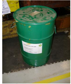
SVV-Lege (60 liter) vetvaten01