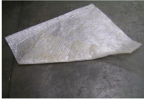
PF-Niet herbruikbare bubbelfolie2