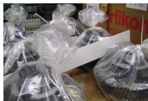
PF-Niet herbruikbare folie10