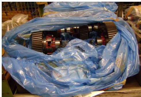
PF-Niet herbruikbare folie06