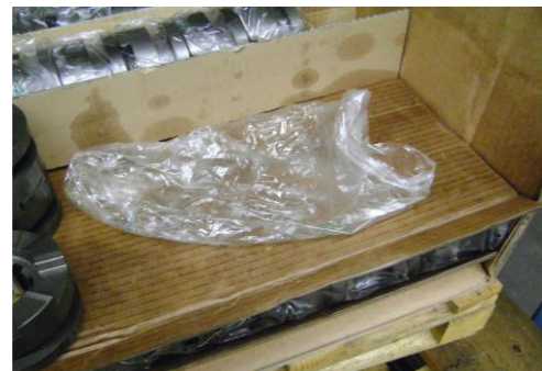
PF-Niet herbruikbare folie09