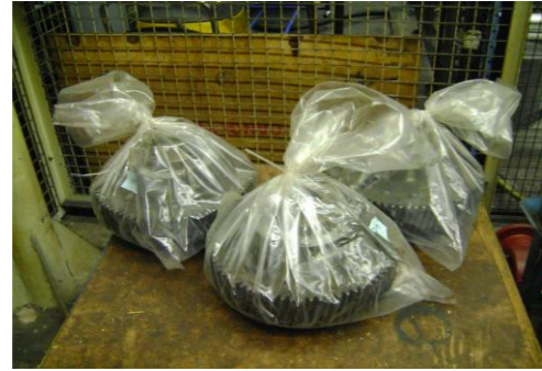
PF-Niet herbruikbare folie08