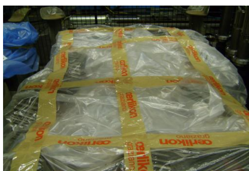
PF-Niet herbruikbare folie07