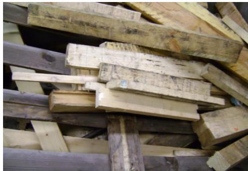
HAA-Niet herbruikbaar hout03