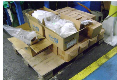
PF-Niet herbruikbare folie05