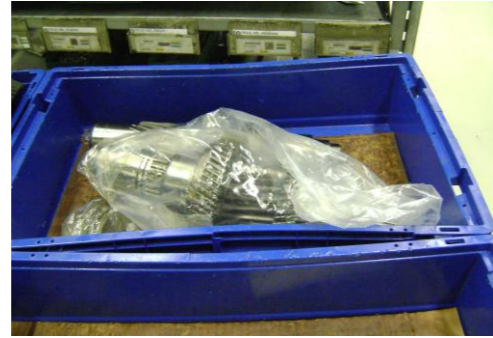
PF-Niet herbruikbare folie04