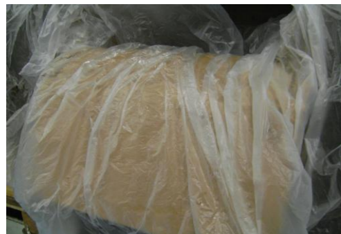
PF-Niet herbruikbare folie02