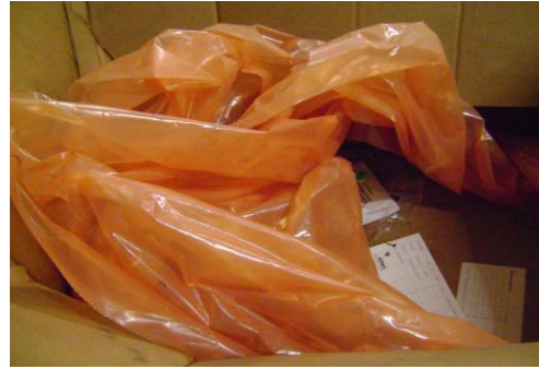
PF-Niet herbruikbare folie01