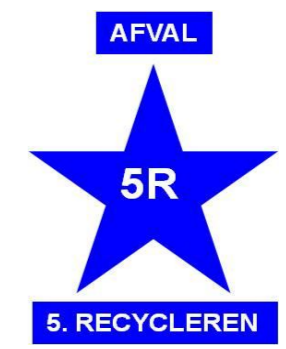
5R - 5.RECYCLE