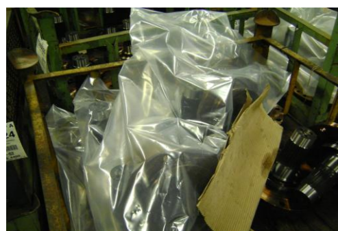
PF-Niet herbruikbare folie03