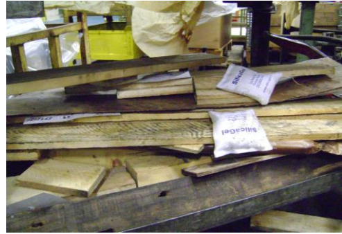
HAA-Niet herbruikbaar hout01