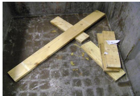
HAA-Niet herbruikbaar hout02