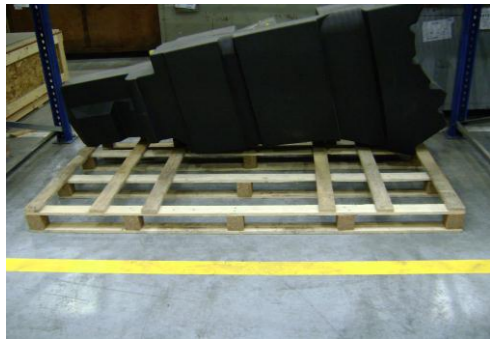
HAA-Niet herbruikbaar hout07