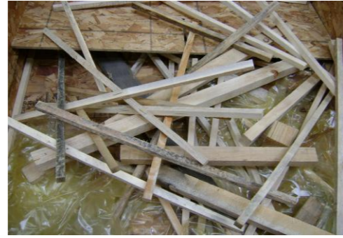
HAA-Niet herbruikbaar hout08