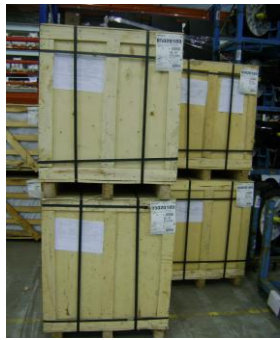
HAA-Niet herbruikbaar hout06