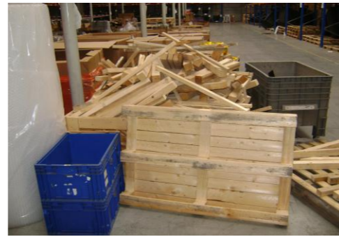
HAA-Niet herbruikbaar hout12