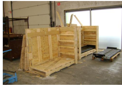
HAA-Niet herbruikbaar hout10