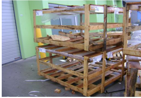
HAA-Niet herbruikbaar hout05