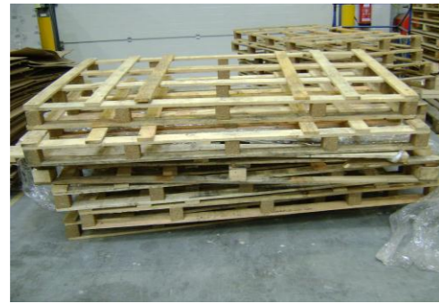
HAA-Niet herbruikbaar hout09