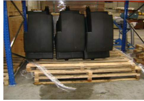
HAA-Niet herbruikbaar hout11