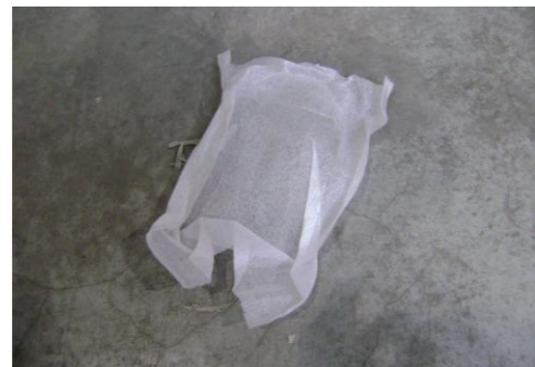
PF-Niet herbruikbare schuimfolie3