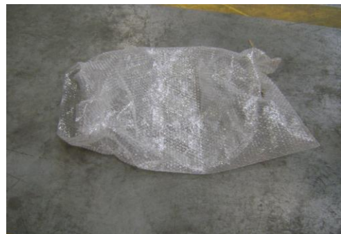
PF-Niet herbruikbare bubbelfolie4