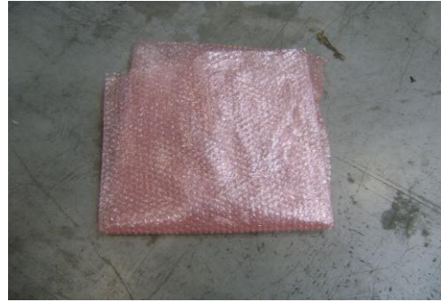
PF-Niet herbruikbare bubbelfolie3