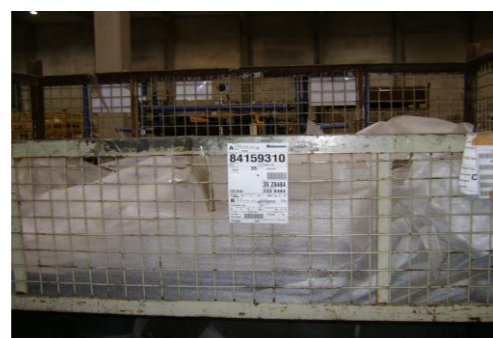
PF-Niet herbruikbare schuimfolie4