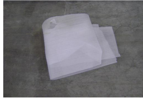
PF-Niet herbruikbare schuimfolie2