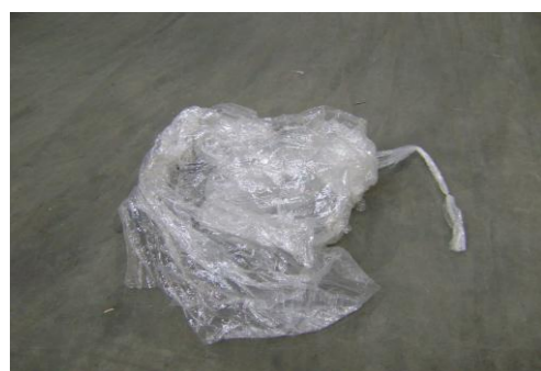
PF-Niet herbruikbare folie11