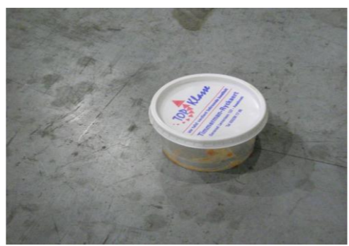
RA-Lege charcuteriepotjes 01