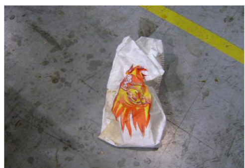
RA-Lege zakken van voeding 01