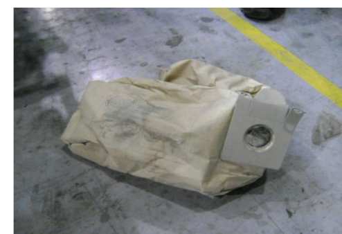
RA-Volle stofzuigerzak 01