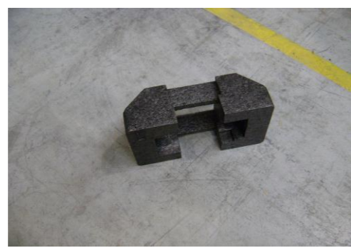
RA-Isomoblokken (zwart) 01