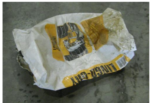
RA-Lege verpakking abs.korrels01