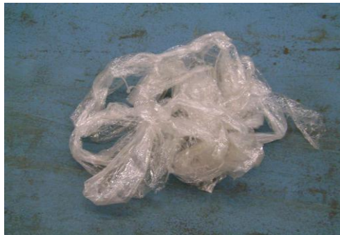
PF-Niet herbruikbare folie23