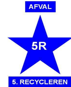
5R - 5.RECYCLE