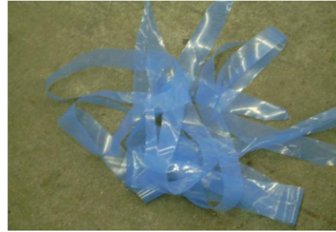
PF-Niet herbruikbare linten2