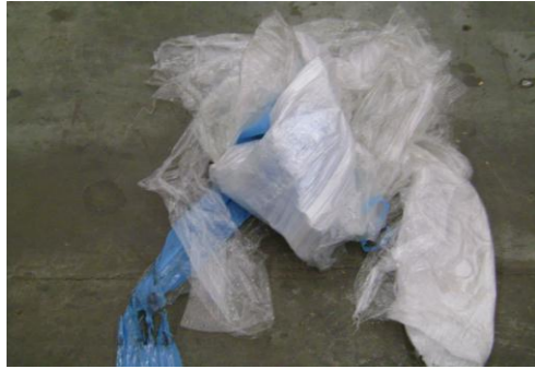
PF-Niet herbruikbare folie21