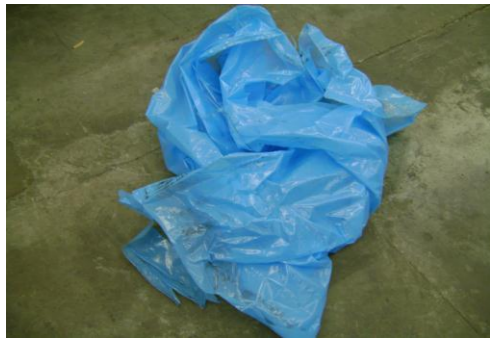
PF-Niet herbruikbare folie22