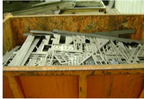
LP-Ongeschilderd plaatafval 01