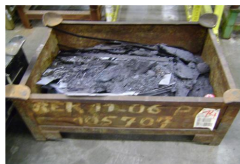
LP-Ongeschilderd plaatafval 06