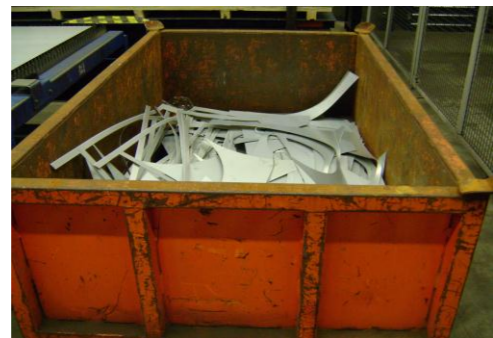
LP-Ongeschilderd plaatafval 05