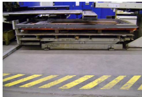
LP-Ongeschilderd plaatafval 02