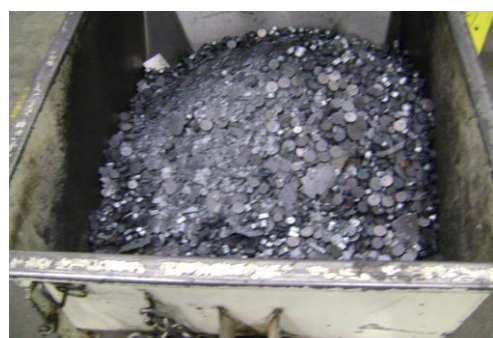
LP-Ongeschilderd plaatafval 03