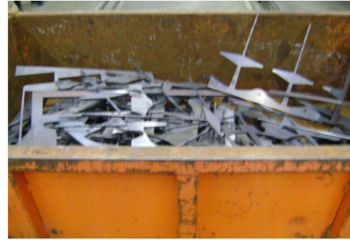
LP-Ongeschilderd plaatafval 04