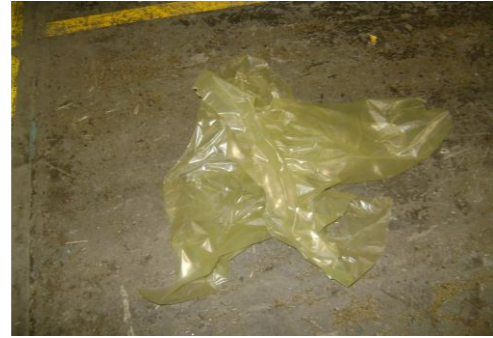
PF-Niet herbruikbare folie26