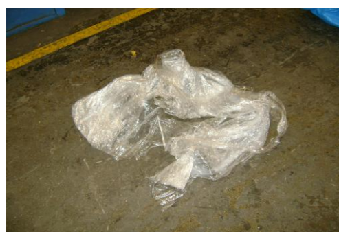
PF-Niet herbruikbare folie25