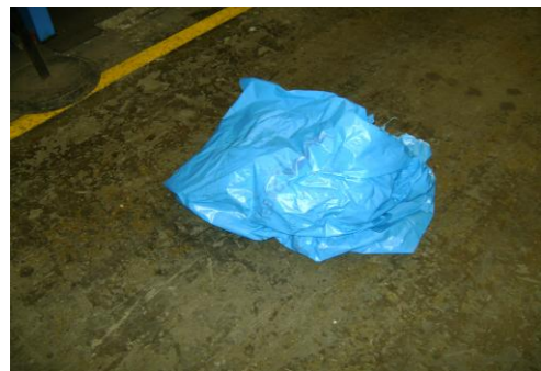
PF-Niet herbruikbare folie24