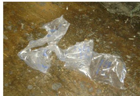
PF-Niet herbruikbare luchtkussens3