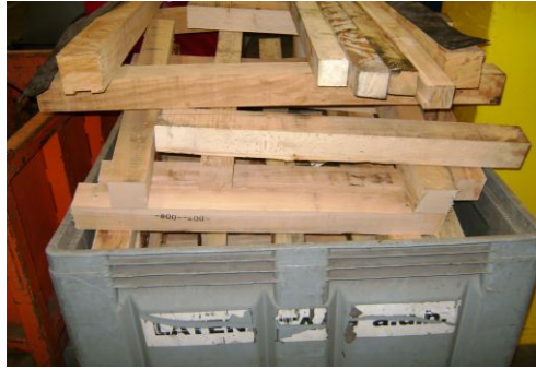
HAA-Niet herbruikbaar hout35