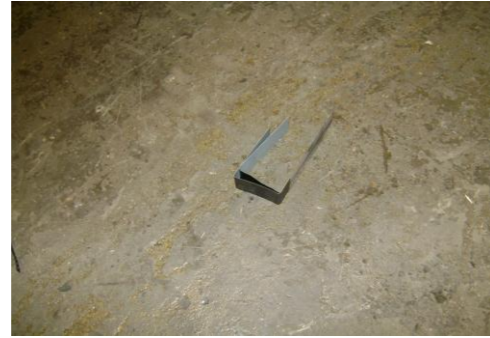
GP-Verschrote onderdelen 08