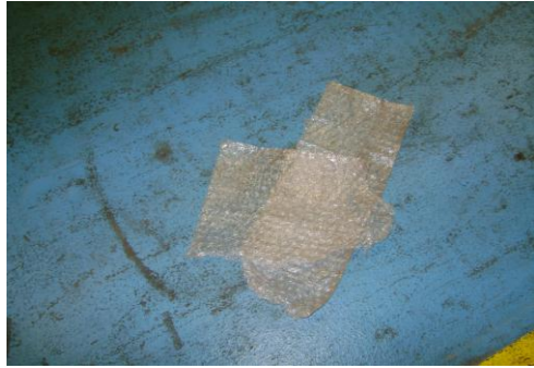
PF-Niet herbruikbare bubbelfolie15