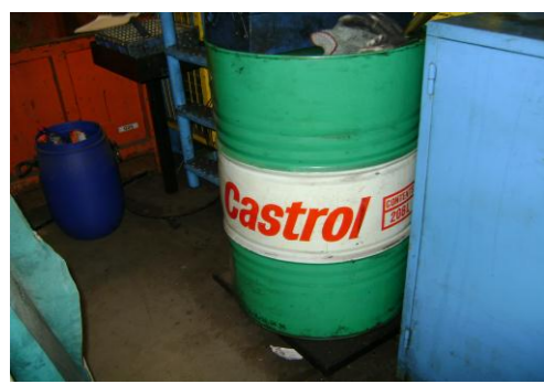
SVV-Lege (200 liter) olievaten05