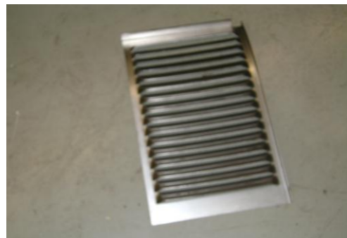
LP-Ongeschilderd plaatafval 11