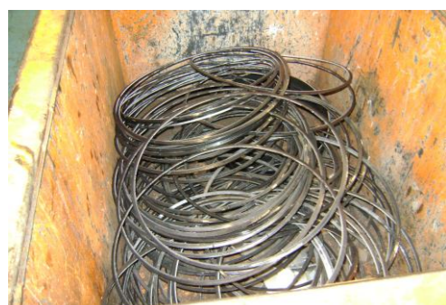
LP-Ongeschilderd plaatafval 12