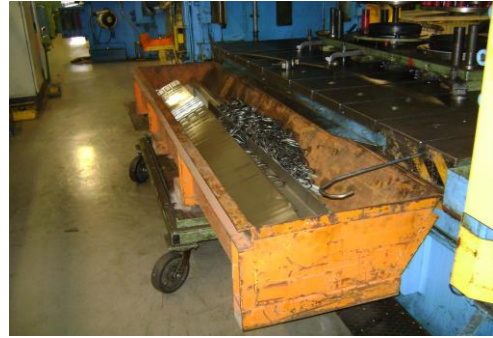
LP-Ongeschilderd plaatafval 10