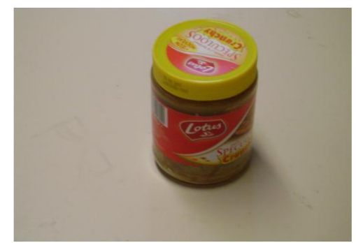
RA-Lege (glazen) potten 01