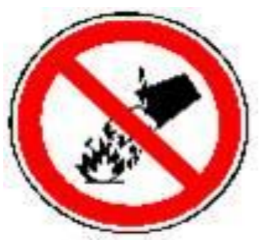
NIET blussen met water