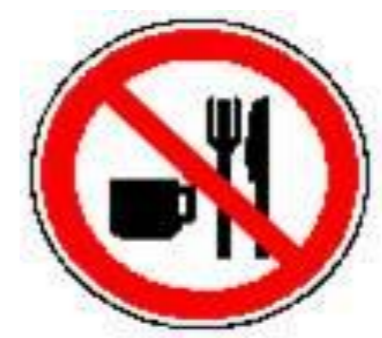
Eten is hier verboden