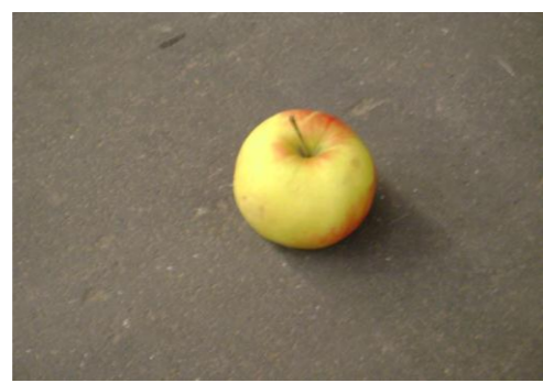
RA-Appel restanten 01