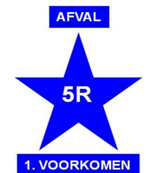
5R - 1.REFUSE