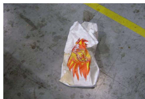
RA-Lege zakken van voeding 01