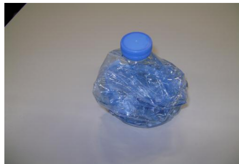
PMD-Lege plast. drankverpakk.07