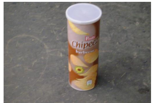
RA-Lege chipsverpakkingen 01