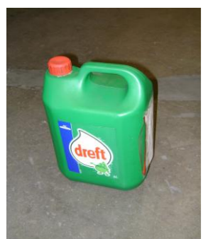
PMD-Lege verpakking kuisprod.3