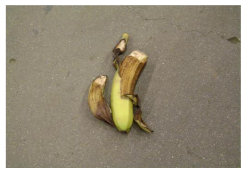
RA-Banaan restanten 01