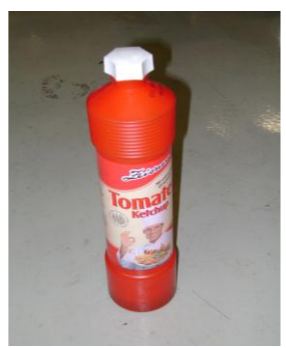
RA-Lege ketchup pulle 01