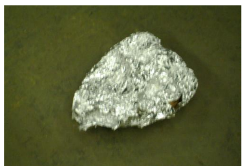
RA-Overschot boterhammen 01