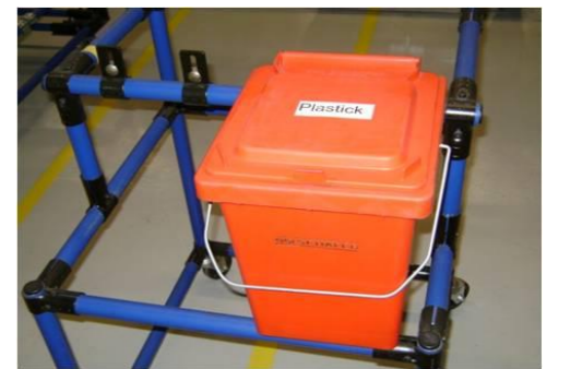
Plastiek folie werkpost