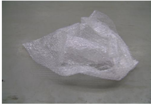
PF-Niet herbruikbare bubbelfolie6