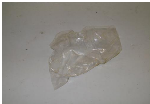
PF-Niet herbruikbare folie12