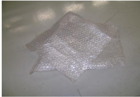
PF-Niet herbruikbare bubbelfolie5