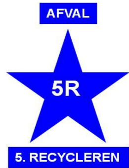
5R - 5.RECYCLE