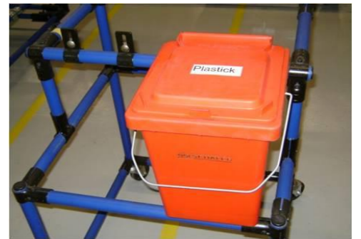
Plastiek folie werkpost