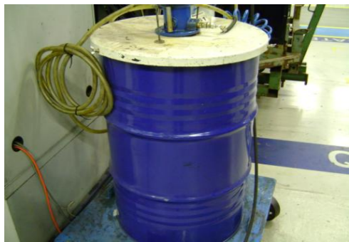
SVV-Lege (200 liter) olievaten09