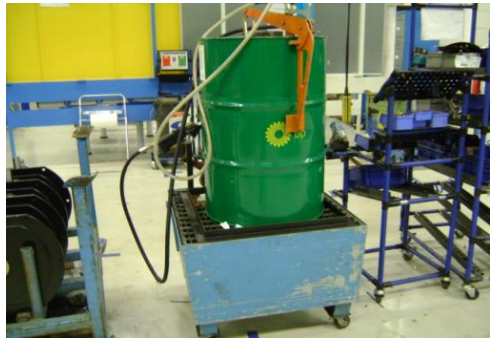
SVV-Lege (60 liter) vetvaten02