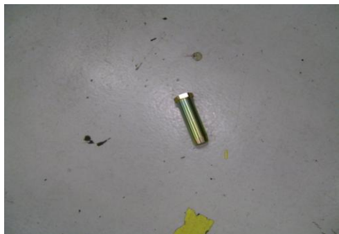
GP-Verschrote onderdelen 15