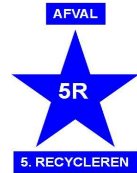
5R - 5.RECYCLE